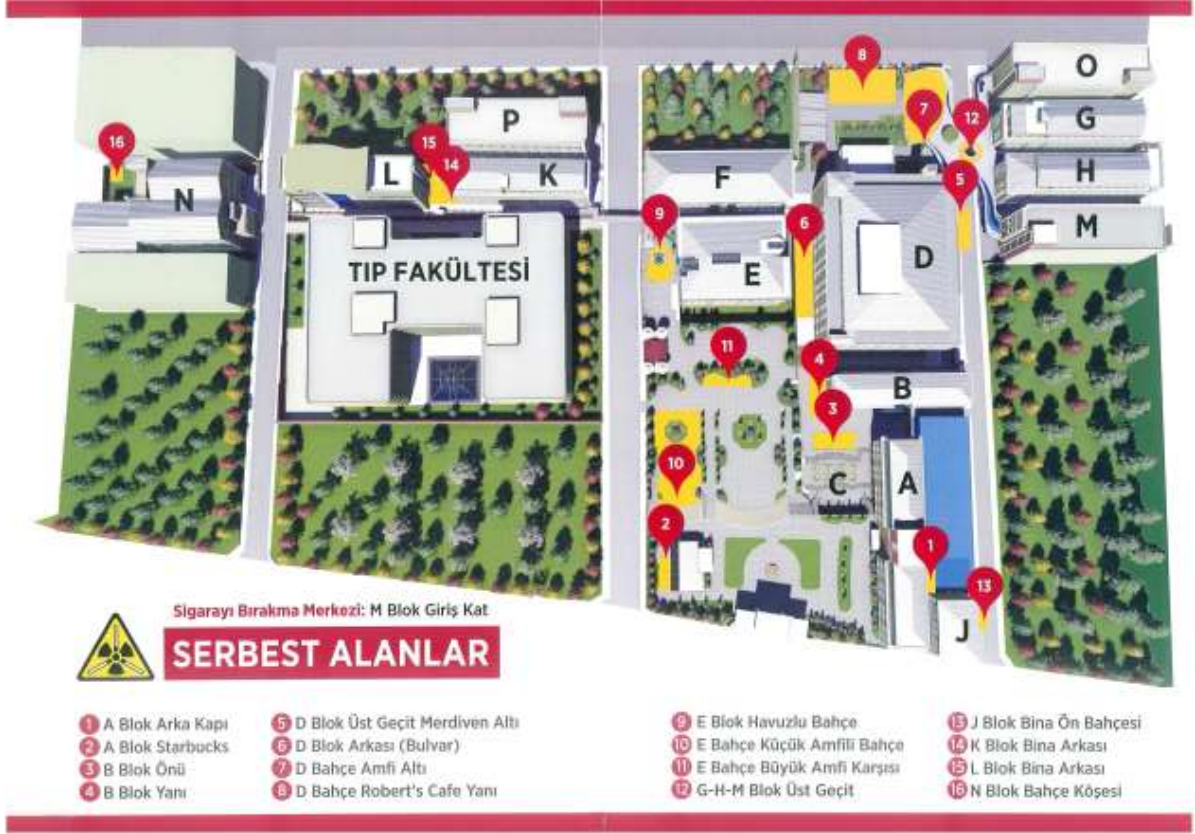
Resim 2: Kampüste Sigara İçiminin Sınırlandırılması