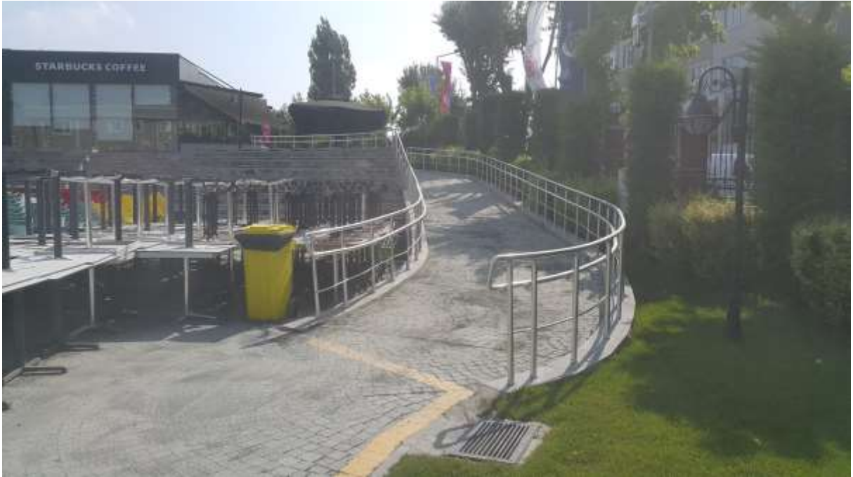
Resim 6: Erişilebilir Kampüs Uygulamalarından Bir Görüntü

İstanbul Aydın Üniversitesi olarak inancımız odur ki; erişilebilirlik kavramı, yaş, cinsiyet, beceri ve durum farkı gözetmeksizin her bireye karşı duyarlı ve daha kolay yaşanabilir bir çevreyi mümkün kılması nedeniyle sürdürülebilirlikle doğrudan ilişkilidir. Bu açıdan sürdürülebilir ve insana saygılı bir kentsel tasarım için erişilebilirlik ve dolayısıyla evrensel tasarım konusuna duyarsız kalınmamalıdır. Üniversitemizde kullanıcı ve çevre arasındaki ilişkiyi kalıcı ve sürdürülebilir hale getirebilmek için için toplumun da bu konuda bilinç kazanması amacıyla çeşitli çalışmalar aktif ve planlı olarak yürütülmektedir.