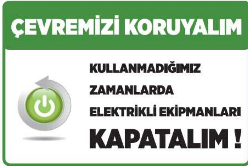
Resim 3: Tasarruf Uyarı Yazısı Örneği