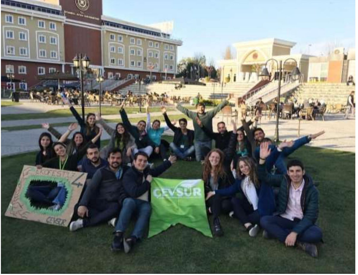
Resim 4: Dünya Çevre Günü Etkinliği