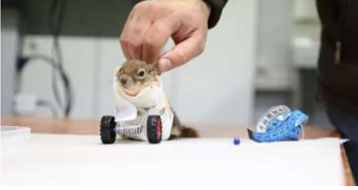
Resim 5: Sincap Protez İşlemi