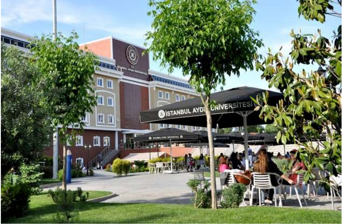
Resim 1: Yerleşke Görünümü